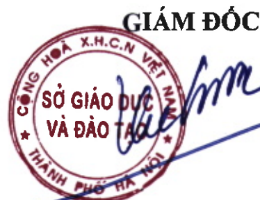
Trần Thế Cường